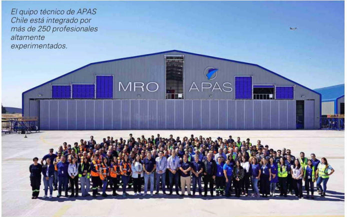
El equipo técnico de APAS Chile está integrado por más de 250 profesionales altamente experimentados.

"Como parte de nuestro plan de expansión, APAS Chile está desarrollando 100.000 m 2 adicionales de losa para sus operaciones y construyendo dos