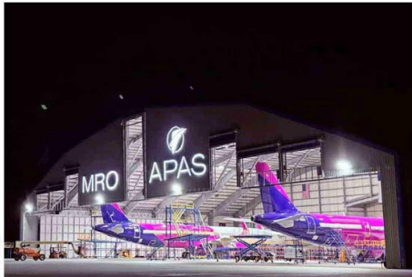
APAS Chile opera en Santiago, siendo la única empresa en Sudamérica de SIP Holding.

— DAS (Diverse Aircraft Services), empresa especialista en reparación de estructuras de