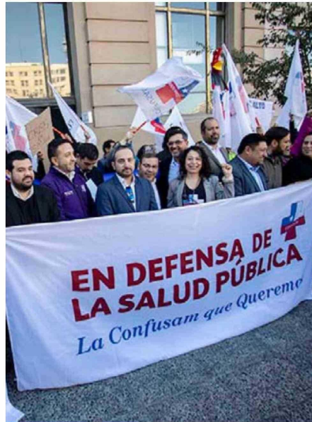
Confusam anunció estado de alerta nacional en atención primaria.

En ese contexto, Confusam anunció el inicio de un estado de alerta nacional en la atención primaria, además de la entrega formal de una carta de rechazo a las medidas adoptadas por el Gobierno.