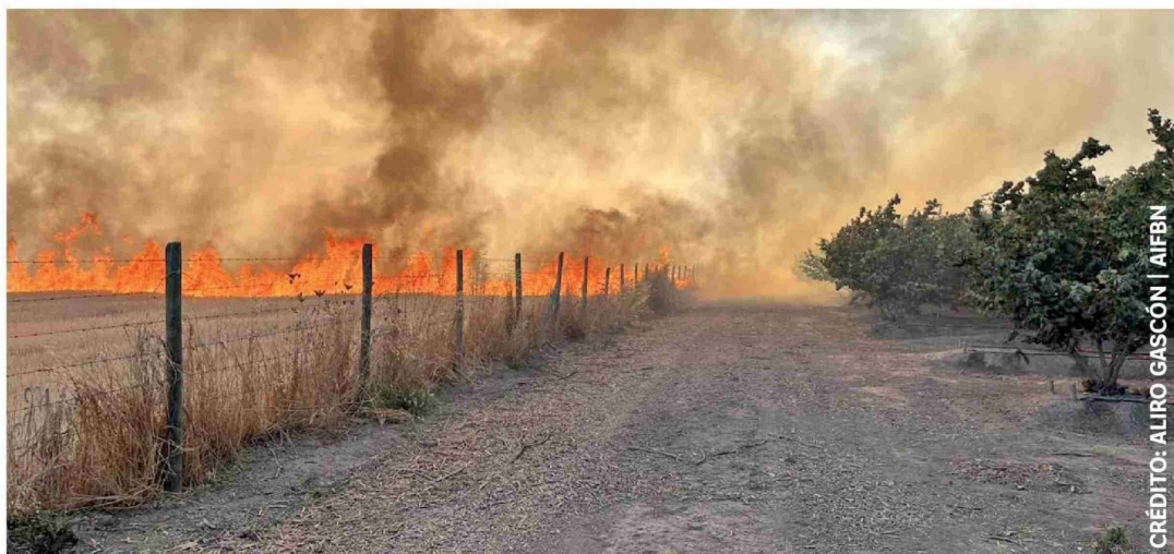
LA REGIÓN DEL BIOBÍO lidera la afectación nacional con 38 incendios y 31.378 hectáreas arrasadas.

La Red Bosquentrama denuncia que el 98,7% de los incendios está vinculado a actividad humana y que el 75% habría sido evitable con medidas preventivas básicas. Dirigentes de zonas afectadas aseguran que existe una desprotección y advierten que cada verano repite el mismo patrón de destrucción.