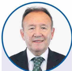
José García Ruminot

SEGPRES: Militante RN. Contador público y auditor. Actualmente, es senador por la 15.ª Circunscripción Sur, Región de La Araucanía. Ejerció como presidente del Senado, entre el 19 de marzo de 2024 y el 26 de marzo de 2025.