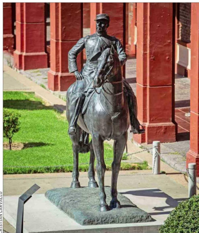
En el patio del Museo Histórico y Militar se encuentra actualmente el general Baquedano.

El Consejo de Monumentos Nacionales votará hoy el traslado de la figura, el cual podrá concretarse en febrero. “Es un símbolo de unión de la ciudadanía”, afirma el sobrino tataranieta del héroe de la Guerra del Pacífico.