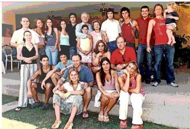
Celebrando sus 80 años, con su señora, sus cuatro hijos y parte de sus 15 nietos y 14 bisnietos.