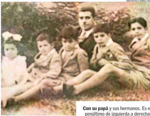
Con su papá y sus hermanos. Es el penúltimo de izquierda a derecha.

cia. "Más que un objeto cotidiano, fueron una revelación". Un descubrimiento, dice, que en su caso se transformaría en su destino.