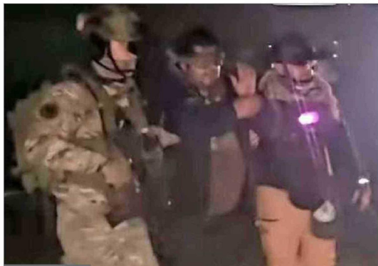
IMAGEN DE VIDEO

El hoy coordinador del Observatorio del Crimen Organizado y Terrorismo (Ocri) de la U. Andrés Bello, agregó que "Huenschullán era el prófugo más buscado de la macrozona sur" y que su detención "deja sin liderazgo al grupo RMM, ya que bajo él existe integrantes que componen una organización horizontal, donde Huenschullán era la única cabeza".