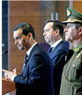
SIN HERIDOS NI DISPAROS.—El fiscal nacional (s), Roberto Garrido, junto a autoridades policiales, detalló cómo ocurrió el procedimiento.

"Seguimos avanzando (...) para restablecer el orden y el estado de derecho (...). Tras cinco años prófugo, ha llegado el momento de que comparezca ante la justicia".