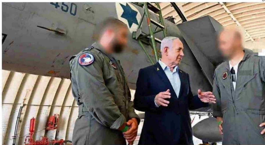
NETANYAHU SEÑALÓ QUE LLEVA MESES PREPARANDO EL ATAQUE SOBRE ISRAEL.

"Haremos lo necesario para lograr estos objetivos y nos