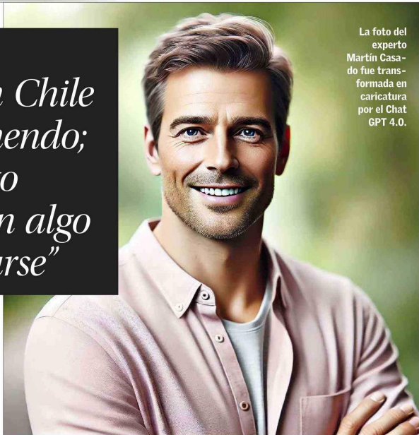
La foto del experto Martín Casado fue transformada en caricatura por el Chat GPT 4.0.

Socio de Andreessen Horowitz, el mayor venture capital del mundo Martín Casado: "En Chile hay un talento tremendo; es un gran momento para involucrarse en algo nuevo y reposicionarse"