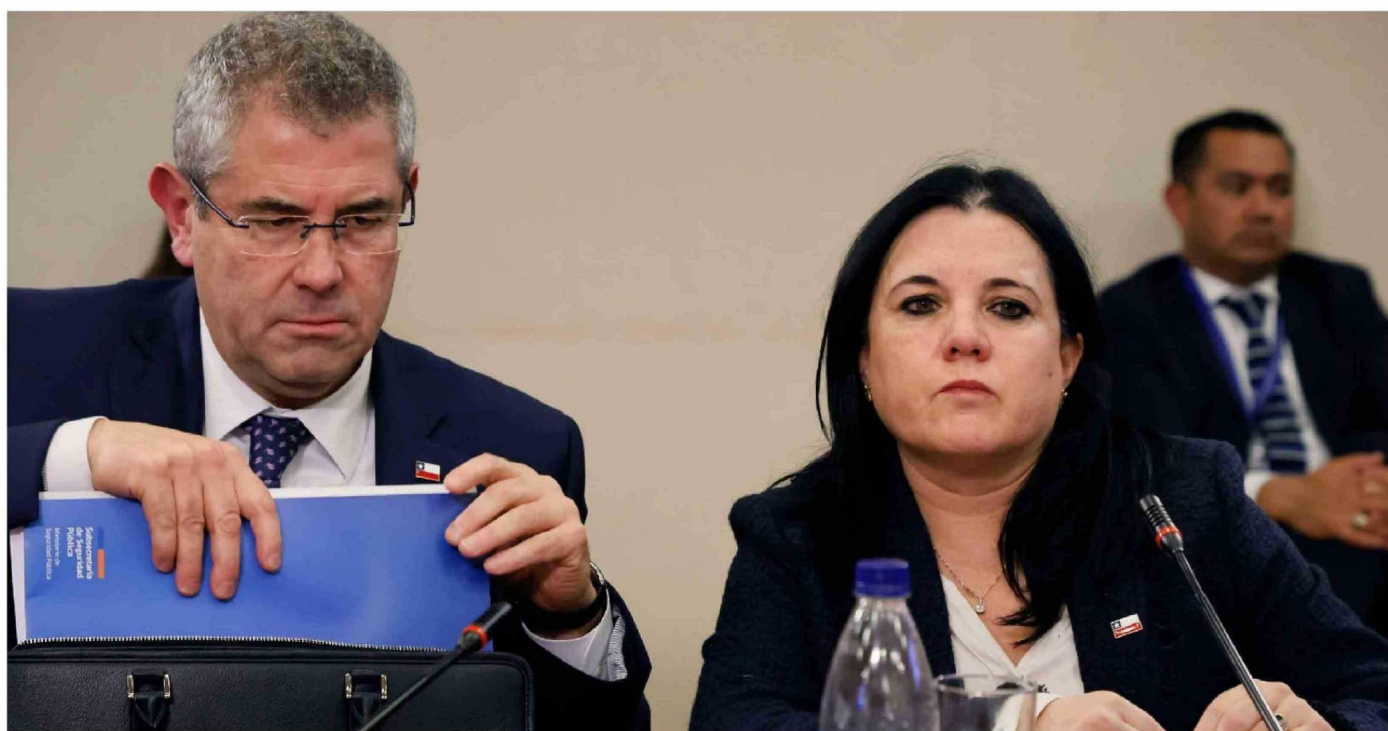
► El subsecretario Andrés Jouannet y la ministra Trinidad Steinert enfrentaron duras críticas tras los recortes en seguridad pública.

Las mayores reducciones de la propuesta, según lo expuso el Ministerio de Seguridad, será en Carabineros y la PDI, así como también en el Plan Contra el Crimen Organizado y Calles sin Violencia. El reclamo del oficialismo apunta a que el recorte en seguridad no se condice con el relato del "gobierno de emergencia".