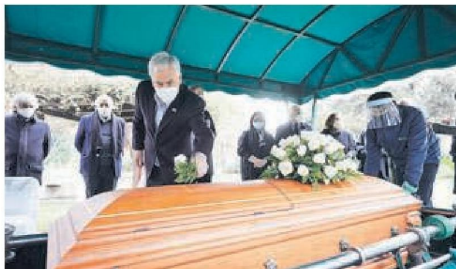
► El presidente asistió al funeral del sacerdote.

Su última aparición pública la hizo para desmentir una acusación de presunto abuso sexual en su contra, la que finalmente no prosperó. "Doy fe de que, durante mi larga vida sacerdotal que comenzó en 1945, siempre he tenido una conducta intachable", señaló en esa oportunidad el exarzobispo emérito de La Serena. ●