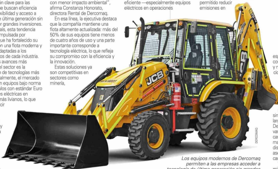
Los equipos modernos de Dercomaq permiten a las empresas acceder a tecnología de última generación sin grandes inversiones iniciales.

logísticas, con tendencia al arriendo de equipos de batería litio— ha permitido reducir emisiones en