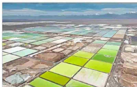
Las acciones de la productora de litio SQM subieron solo 0,46% tras los anuncios de ayer.