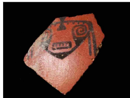
Trozo de cerámica Copiapó, negro sobre rojo