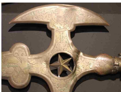
Alabarda del Batallón Atacama