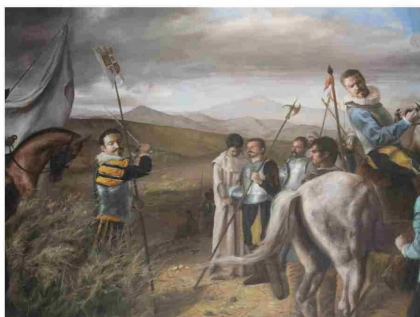
Cuadro de Toma de Posesión de Chile, de Guillermo Lorca García -Huidobro