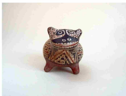
Tigrillo, pieza ceremonial Diaguita