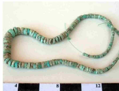
Collar de cuentas de piedra