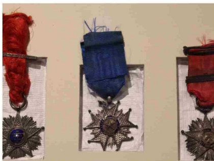
Insignias y condecoraciones del batallón Atacama