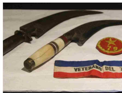
Corvos del batallón Atacama