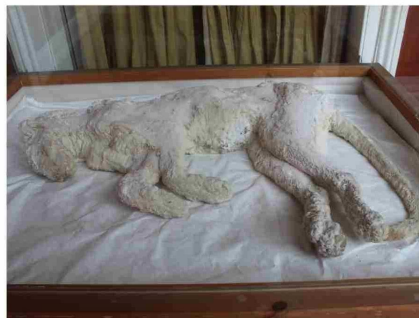
Puma disecado en sal, encontrado en Laguna Verde