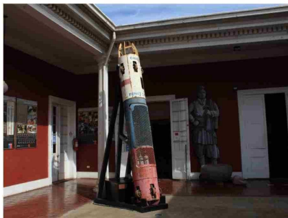
Cápsula fénix 2

Título: El Museo Regional de Atacama (1973 — 2023): 50 años poniendo en valor la historia y el patrimonio de la región