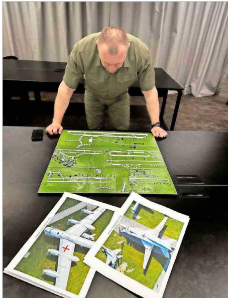
EL JEFE del Servicio de Seguridad de Ucrania, Vasyl Malyuk, mira un mapa que muestra una base aérea militar rusa.

El Ministerio de Defensa ruso afirmó que drones ucranianos atacaron aeródromos en cinco regiones y que varios aviones fueron incendiados.