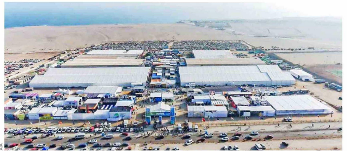
Exponor 2026 proyecta una participación récord de empresas en un contexto de expansión de la industria minera, consolidándose como un espacio clave para el encuentro y generación de nuevos negocios.

El nuevo ciclo de expansión que vive la industria minera comienza a reflejarse con fuerza en la próxima versión de Exponor 2026, exhibición internacional organizada por la Asociación de Industriales de Antofagasta (AIA) que este año alcanzará un total de 1.300 empresas expositoras, cifra récord que confirma el interés del sector por fortalecer sus redes comerciales y proyectar nuevas oportunidades de negocio.