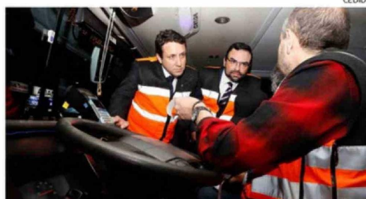
SE ACTIVÓ EL PLAN NACIONAL DE FISCALIZACIÓN AL TRANSPORTE INTERURBANO DE PASAJEROS.

2.000 controles de fiscalización a nivel regional. Nuestro deber principal es resguardar la seguridad de todas las personas que viajarán en estos días, por lo que