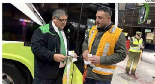
SE EXTREMA EL CONTROL PARA LOS BUSES INTERURBANOS.