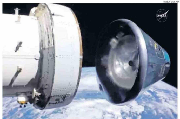
LA CÁPSULA ORION SE DESACPLA DEL MÓDULO DE SERVICIO PARA INICIAR EL REINGRESO A LA TIERRA.