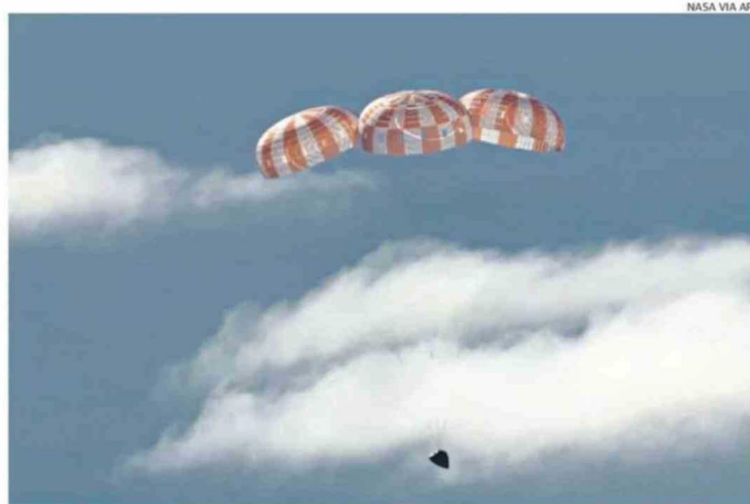
LOS PARACAÍDAS AYUDARON A LA CÁPSULA A DESACELERAR ANTES DE AMERIZAR.

Añadió que espera recibir pronto a los astronautas en la Casa Blanca. C3