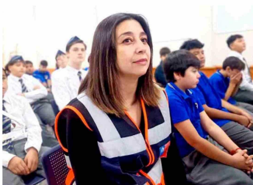
Durante la jornada, autoridades y comunidad educativa reflexionaron sobre la importancia de aprender de las catástrofes naturales ocurridas en el país.

LA ACTIVIDAD REUNIÓ A AUTORIDADES, ORGANISMOS DE EMERGENCIA Y COMUNIDADES EDUCATIVAS PARA FORTALECER LA CULTURA PREVENTIVA Y RELEVAR LA IMPORTANCIA DEL AUTOCUIDADO FRENTE A SITUACIONES DE RIESGO.