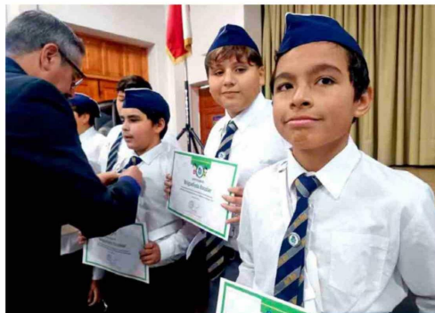
La comunidad educativa del Colegio Moisés Mussa encabezó jornada de reflexión y aprendizaje en torno a la cultura preventiva frente a emergencias socio-naturales.