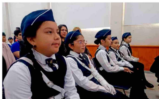
El Colegio República Argentina se sumó a la jornada, participando activamente de las actividades orientadas a la prevención y educación sobre riesgos.