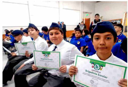
Integrantes de las brigadas escolares recibieron un reconocimiento por su compromiso con la seguridad y bienestar de sus comunidades educativas.