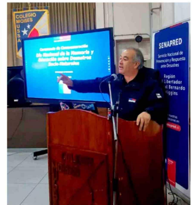
La conmemoración permitió visibilizar el trabajo colaborativo entre establecimientos educacionales y organismos de emergencia de la región.

quienes aportaron desde sus áreas al desarrollo de esta instancia formativa.