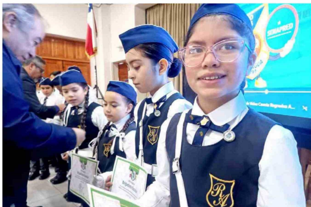
La actividad reunió a estudiantes en una instancia orientada a fortalecer comunidades escolares más preparadas y resilientes.

Con una jornada marcada por la reflexión, la prevención y el compromiso con la seguridad escolar, el Colegio Moisés Mussa fue sede de la conmemoración del Día Nacional de la Memoria y Educación sobre Desastres Socio-Naturales, instancia instaurada por la Ley N° 21.454, que establece cada 22 de mayo como una fecha para promover la conciencia frente a los riesgos y recordar a las víctimas del histórico terremoto de Valdivia de 1960.