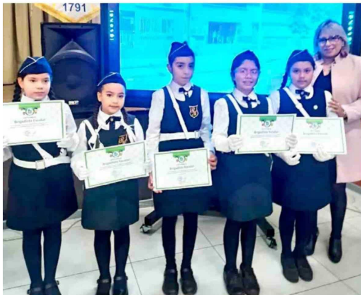
Estudiantes del Colegio República Argentina participaron en la conmemoración del Día Nacional de la Memoria y Educación sobre Desastres Socio-Naturales.