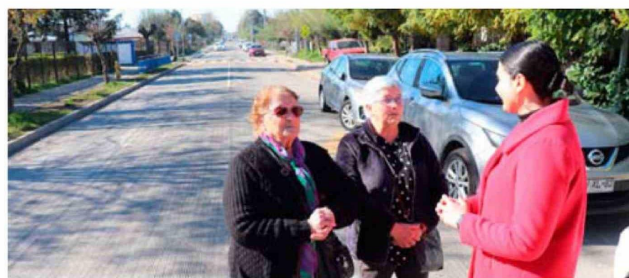
El antes y después en la Villa Esperanza, una obra con más de $340 millones de inversión