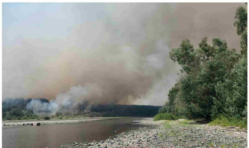
LOS INCENDIOS EN LA ZONA DE SANTA FE han consumido cerca de 184 hectáreas, con llamas que superaron los 50 metros de altura y generaron densa nube de humo.

"Aquí mucha gente arriesgó su vida. Toda la comunidad se organizó para ayudarse unos a otros. Vinieron vecinos de distintos sectores, y estuvimos toda la tarde tratando de apagar el incendio", explicó.