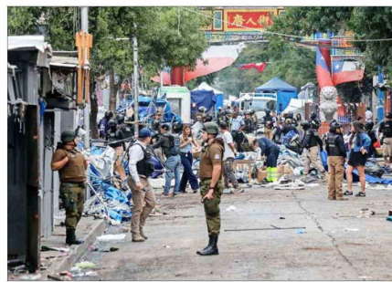
CIERRE. — El perímetro intervenido este martes y miércoles permanecerá cerrado, por lo que vendedores no podrán abrir hasta el jueves.