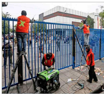
CONTROL. — En el nuevo cierre habrá guardias que controlarán el paso, así como los productos que se ingresen.