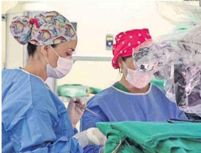
DURANTE EL 2024, 30 MÉDICOS ESPECIALISTAS RENUNCIARON AL HOSPITAL REGIONAL.

Es más, si se consideran las renunciaciones de especialistas desde el año 2020 a la fecha, 210 médicos han dejado el Hospital