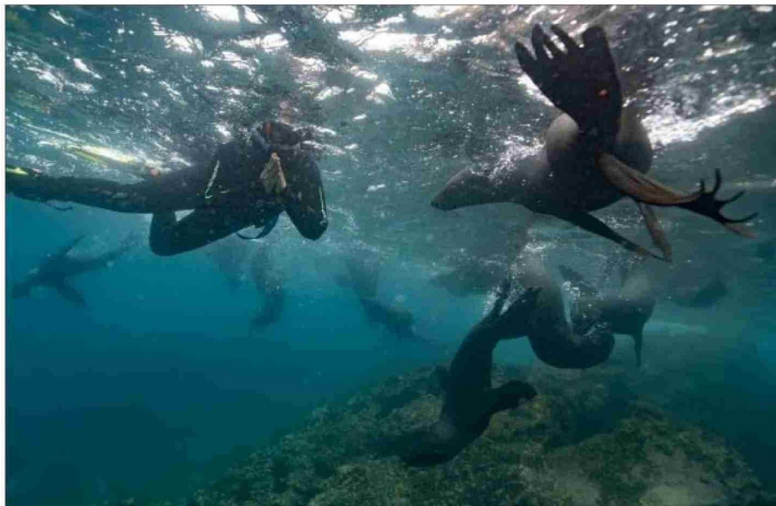
"Los parques marinos que tiene Juan Fernández, considerando a las Islas Desventuradas, son los segundos más grandes de toda América", dice el alcalde de Juan Fernández.