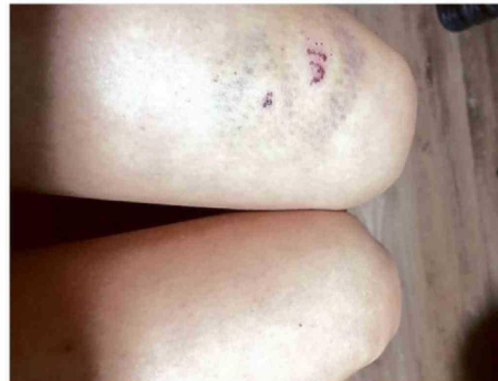
BARRERA QUEDÓ CON RASGUÑOS Y GOLPES POR UN TRONCO.