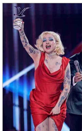
Mon Laferte marcó el peak del Festival de Viña 2026.

personas. “Los eventos importantes tiene un alcance importante y gran cantidad de visualizaciones. En el día a día también están las telenovelas y