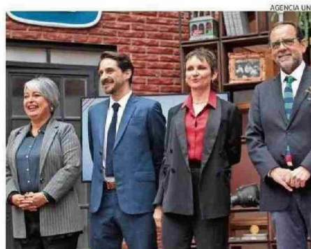
EL DEBATE FUE TELEVISADO POR CANAL 13.