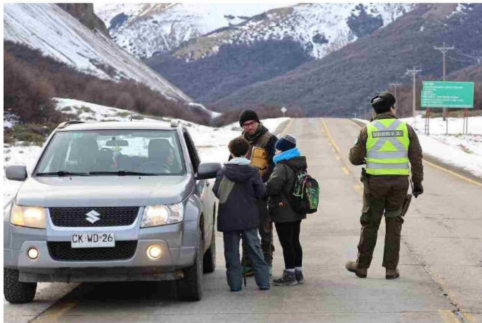
Con patrullajes educativos, comenzó la iniciativa que busca prevenir atropellos y visibilizar las amenazas que ponen en riesgo al huemul en el Parque Nacional Cerro Castillo.

Con sólo 1.500 huemules en estado silvestre, su conservación es crítica debido a la pérdida de hábitat, enfermedades transmitidas por el ganado, ataques de perros sueltos y atropellos. En el Parque Nacional Cerro Castillo, donde vive el 10% de la población, la Carretera Austral representa una amenaza constante.