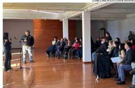
LOS DIRIGENTES VECINALES HICIERON PROPUESTAS Y PREGUNTAS.

Para cumplir con lo anterior, el diseño contempla también más de 140 expropiaciones entre sitios y viviendas, estando la mayoría en los tramos dos y tres. "Todas estas expropiaciones son a un precio comercial y serán hasta el momento sólo en Pueblo Nuevo, no existiendo inconvenientes de parte de los vecinos. De hecho la gente lo estaba esperando", afirmó.