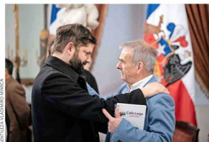
"Yo creo que nunca se va a ir de la política. Será un referente de la centroizquierda y ayudará a construir una oposición que no cometa los errores del pasado".