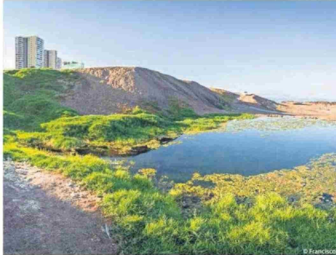
LA INICIATIVA BUSCA RESGUARDAR LOS HUMEDALES DE ANTOFAGASTA.

La elaboración del instrumento se realizó con un enfoque participativo, incorporando observacio-