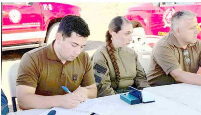
Carabineros ha sido una de las instituciones que se ha sumado a las labores en terreno.