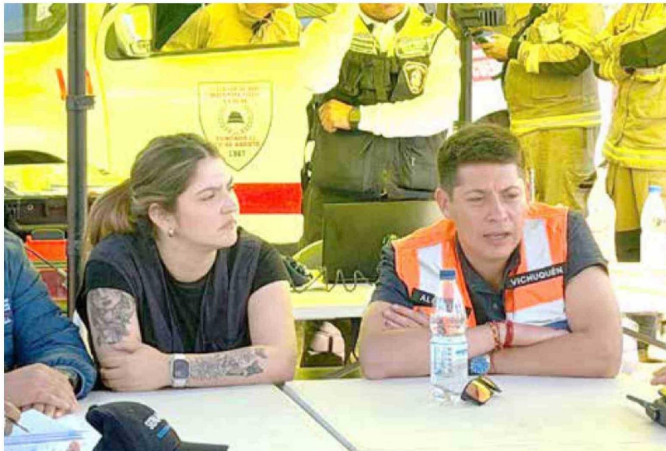
Autoridades participaron ayer de un Comité de Gestión del Riesgo de Desastres.

Tiraje: 4.200 Lectoría: 12.600 Favorabilidad: No Definida