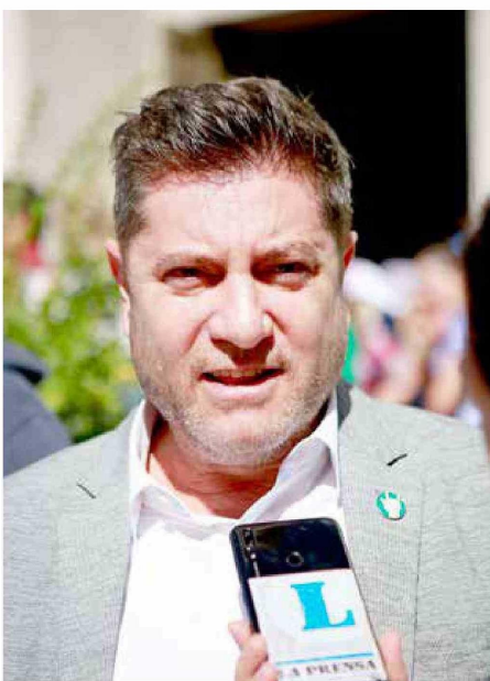
El embajador de Israel, Peleg Lewi, dijo que fue un honor recibir invitación para participar en la celebración y además de la oportunidad de tener reuniones para hablar un poco de proyectos de cooperación entre Israel y Talca.