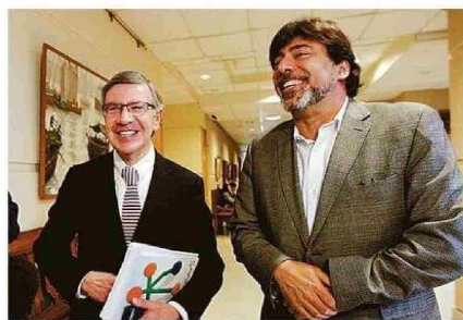
LAVÍN Y JADUE, TRES AÑOS ANTES DE COMPETIR EN LAS PRIMARIAS 2021.

Además, el sondeo revelaba que las preferencias presidenciales espontáneas dejaban a Daniel Jadue y Joaquín Lavín en los primeros lugares, con 18% y 13% respectivamente. El entonces alcalde de Recoleta subía dos puntos porcentuales, mientras que el jefe comunal de Las Condes bajaba un punto respecto a la medición anterior. Un mes antes de las primarias, la encuesta Cadem del 21 de junio de 2021 posicionaba a Lavín en la delantera al interior de Chile Vamos,