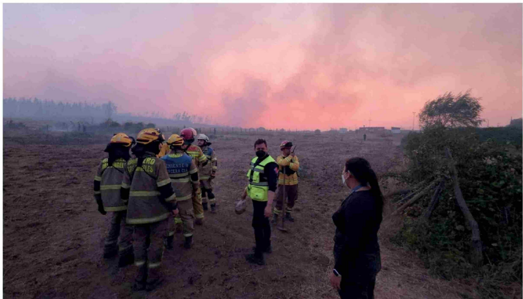
EN EL SECTOR DE ALAMEDA SUR, en la localidad de Santa Fe, Los Ángeles, las autoridades activaron alarmas SAE de evacuación durante la tarde y noche del lunes.

Durante el último balance del Comité para la Gestión del Riesgo de Desastres (Cogrid) de este lunes se informó que existen 573 personas albergadas, 536 viviendas destruidas y 31 incendios en combate en las regiones de Ñuble y del Biobío. Adicionalmente, las autoridades evacuaron diferentes sectores de Los Ángeles, mientras en Laja se combate un siniestro que ya consumió 4.100 hectáreas, con riesgo de propagación a comunas vecinas.