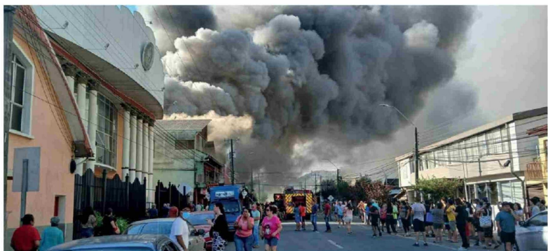
EN LA RUTA Q-90, FRENTE AL SECTOR DE CHILLICO, en la comuna de Laja, se combate un siniestro que ya consume 4.100 hectáreas y amenaza con propagarse hacia Yumbel y Cabrero.

Salcedo destacó la respuesta comunitaria para proteger las viviendas. "Cerca de los condominios y de las villas, como Malalhue, hicieron cortafuegos. Llegaron máquinas y tractores. Acá se está haciendo lo que más se puede", explicó. En paralelo,