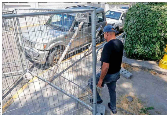
RECLAMOS. — Los vecinos critican el cierre perimetral por las molestias que les genera en su desplazamiento.

Residentes reclaman y dicen que "no se puede vivir así". Alcalde de Ñuñoa presentó recurso de protección, pero empresa defiende la medida por seguridad. Especialistas sugieren mover shows fuera del centro urbano.