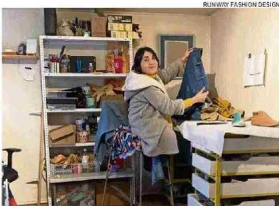
HOY Y MAÑANA SE REALIZARÁ UN SEMINARIO.

"Si bien no existe un seguimiento a los proyectos o marcas una vez que termina el trabajo en la región, RFD las sigue considerando como parte de su comunidad por lo que de alguna u otra manera siempre se le entregará apoyo. Generamos una oportunidad de participar en el programa sin costos per-