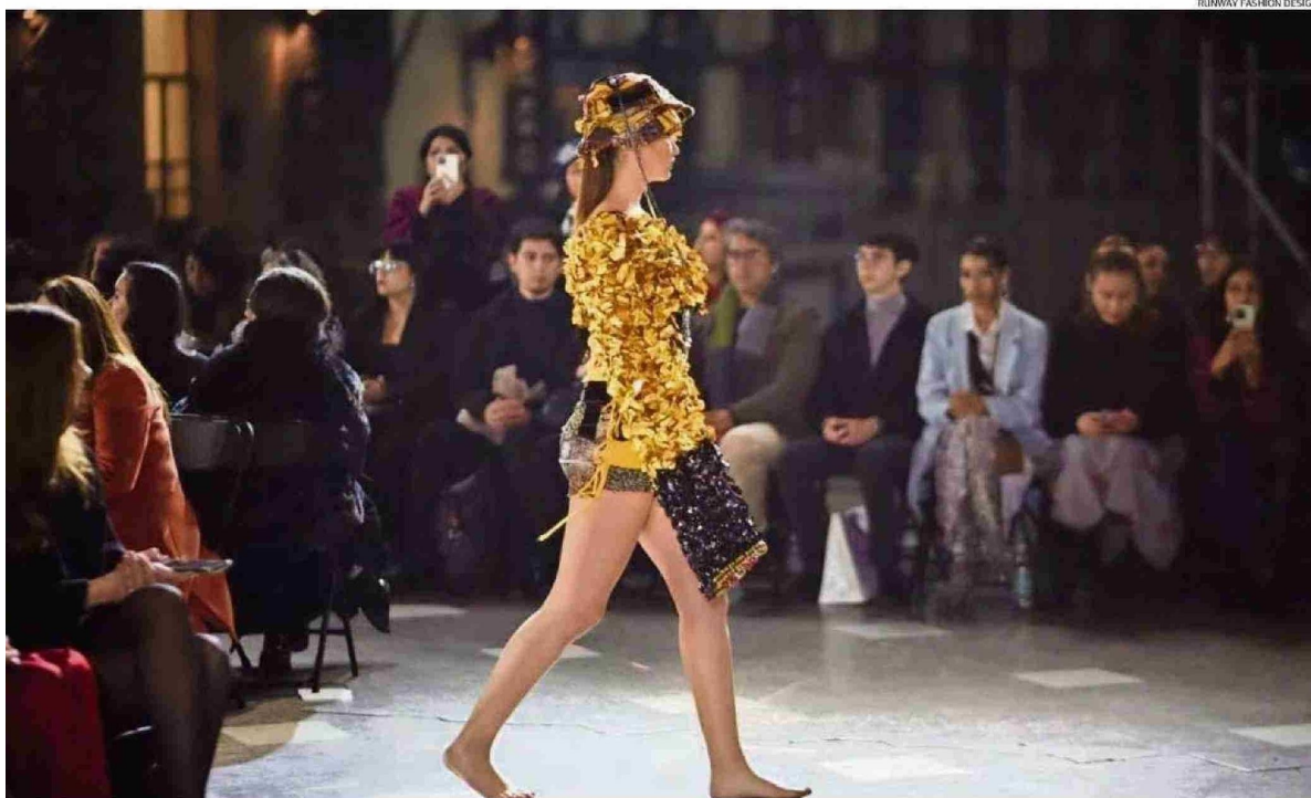
BOR DE LOS EQUIPOS REUNIDOS EL AÑO PASADO SE CONOCERÁ EL VIERNES PRÓXIMO EN UNA DESFILE CON ENTRADA LIBERADA EN EL AERÓDROMO LAS MARÍAS.

ACTIVIDAD. Profesionales del diseño y la artesanía fueron convocados para trabajar en equipo en la creación de lecciones de alta moda con lo regional. Proceso inició el año pasado y finalizará esta semana. Considera además un ingreso internacional y una gran pasarela.