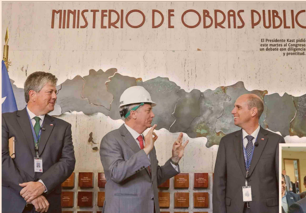
El Presidente Kast pidió este martes al Congreso un debate con diligencia y prontitud.