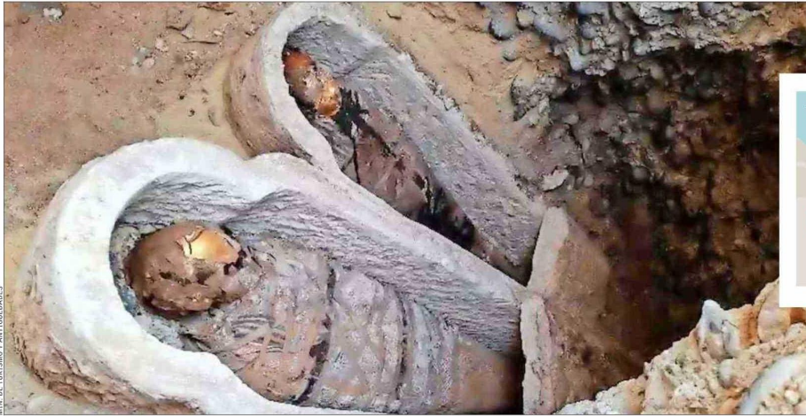
MIN. DE TURISMO Y ANTIGÜEDADES

“En Oxirrincó los papiros —siempre con textos en griego— se hallan sobre los individuos momificados de época romana, y por lo general, están sellados con un sello de limo. Los textos tienen carácter mágico y