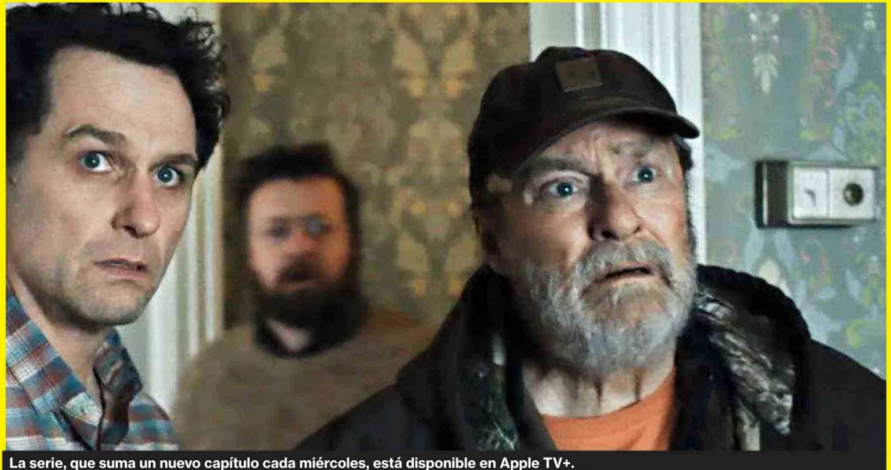
La serie, que suma un nuevo capítulo cada miércoles, está disponible en Apple TV+.

Con el correr de los capítulos (recién vamos en el cuarto; hay estrenos semanales cada miércoles), "La maldición de Widows Bay" deja de utilizar el pueblo como simple escenario y lo convierte en el verdadero núcleo dramático. Widows Bay empieza a sentirse como un organismo vi-