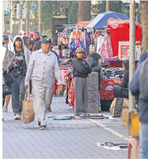
Una de las cifras más bajas habla de que encontrar trabajo en la región "es difícil".

Ulloa planteó que la región arrastra dificultades estructurales