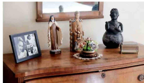
Muchos de los objetos que hay en la casa son regalos que le hicieron durante su mandato.