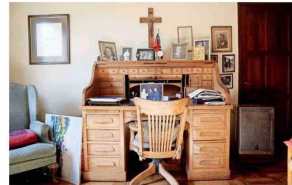
En este escritorio , regalado por su suegro, el expresidente trabajaba cuando no iba a su oficina.