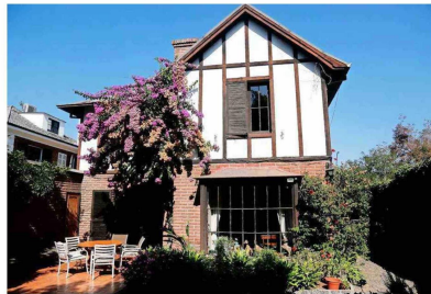
La casa fue diseñada el año 56 por el arquitecto Tomás Reyes, quien después fue senador DC. Fue el hogar de la familia durante 65 años, y es posible que se convierta en el domicilio particular de quien decida desembolsar los poco más de 700 millones de pesos en que está tasada la propiedad.