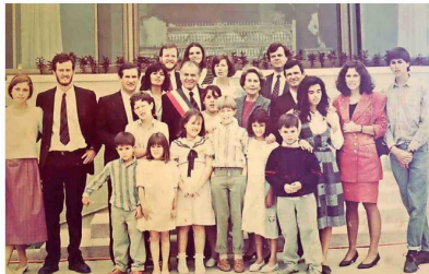
Un retrato familiar de Aylwin como Presidente , con todos sus hijos y nietos.