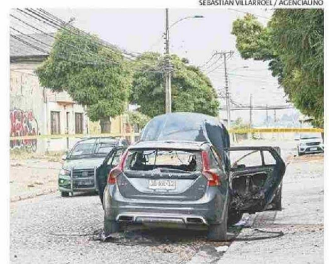
TRES JÓVENES FALLECIERON TRAS UNA BALACERA REGISTRADA A FINES DEL AÑO 2022 EN EL BARRIO BOHEMIO DE CONCEPCIÓN.

Desde 2017 en adelante, el Gran Concepción ha sido testigo de varios casos de homicidios y balaceras con heridos en terreno de las discotecas penquistas.