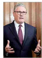
Primer Ministro británico, Keir Starmer, busca relanzar su mandato, mientras crece la sombra de una rebelión interna tras debate electoral del laborismo. | A 4

Crece la tensión entre La Moneda y los partidos opositores, en medio del debate por el Plan de Reconstrucción: Presidente Kast emplaza al PC por "agitar las calles", mientras la oposición concreta su amenaza de "tsunami" con más de 1.500 indicaciones