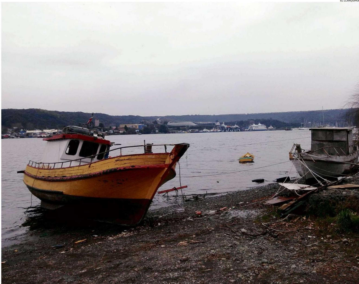
MEJORAR LA CONECTIVIDAD ES OTRO DE LOS PUNTOS QUE PREOCUPAN A LOS VECINOS. (viene de la página anterior)