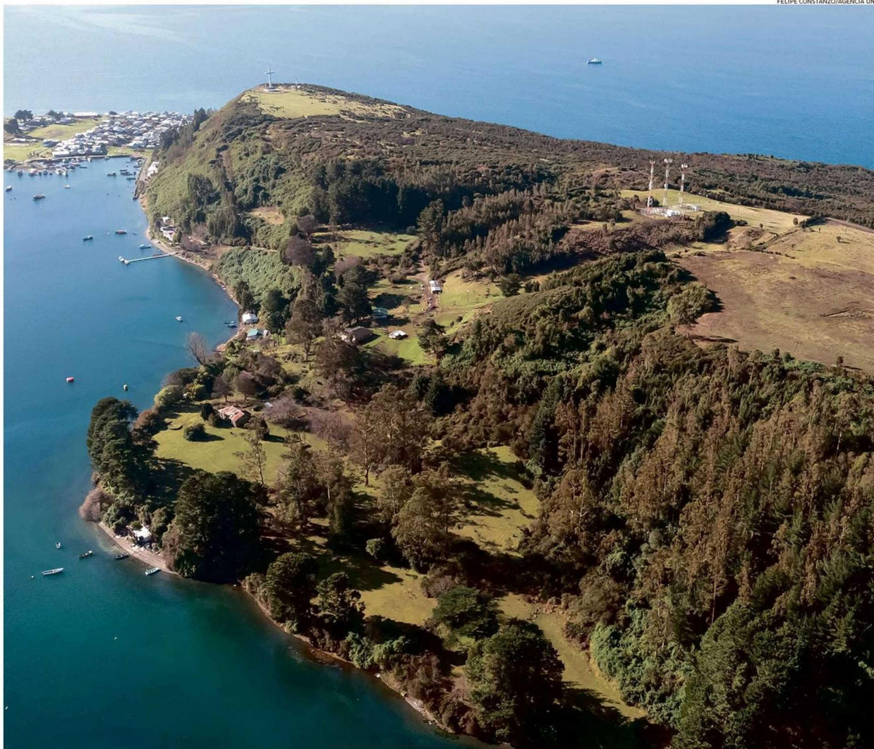
UNOS 10 MINUTOS TARDA UNA EMBARCACIÓN EN LLEGAR A LA ISLA DESDE PUERTO MONTT.