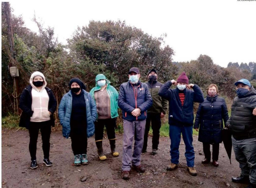
LOS VECINOS ALEGAN POR MEJORES CONDICIONES DE INFRAESTRUCTURA EN LA ISLA.

Durante el día de la recolección, el personal se dirige al lugar, premunido con sacos vacíos, para realizar el trabajo de disponer dentro de estos el contenido, es decir, los residuos provenientes del circuito de recolección que se realiza en los pasajes o calles interio-