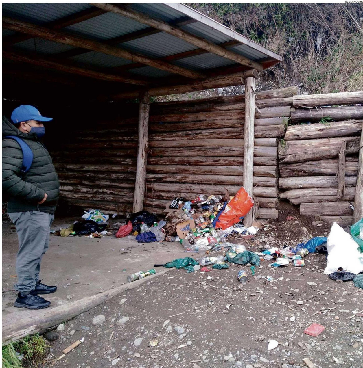
UN MEJOR MANEJO DE LA BASURA ES UNO DE LOS PROBLEMAS MÁS URGENTES QUE ACUSAN LOS VECINOS.