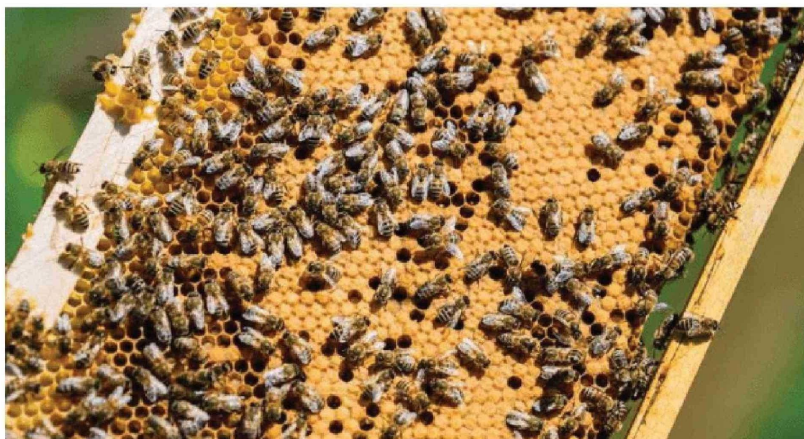
COLMENA DE ABEJAS MELÍFERAS en actividad, utilizada como referencia visual para abordar la situación sanitaria de la varroasis en la apicultura.