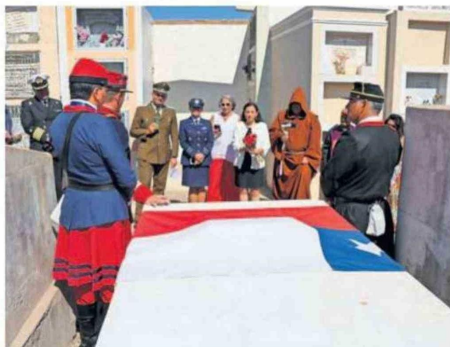
SE VISITARON SEPULCROS DE QUIENES NO ESTÁN EN EL MAUSOLEO.

Autoridades civiles y militares recorrieron el cementerio visitando las sepulturas de los viejos veteranos que lucharon en la Guerra del Pacífico y que descansan en Antofagasta.