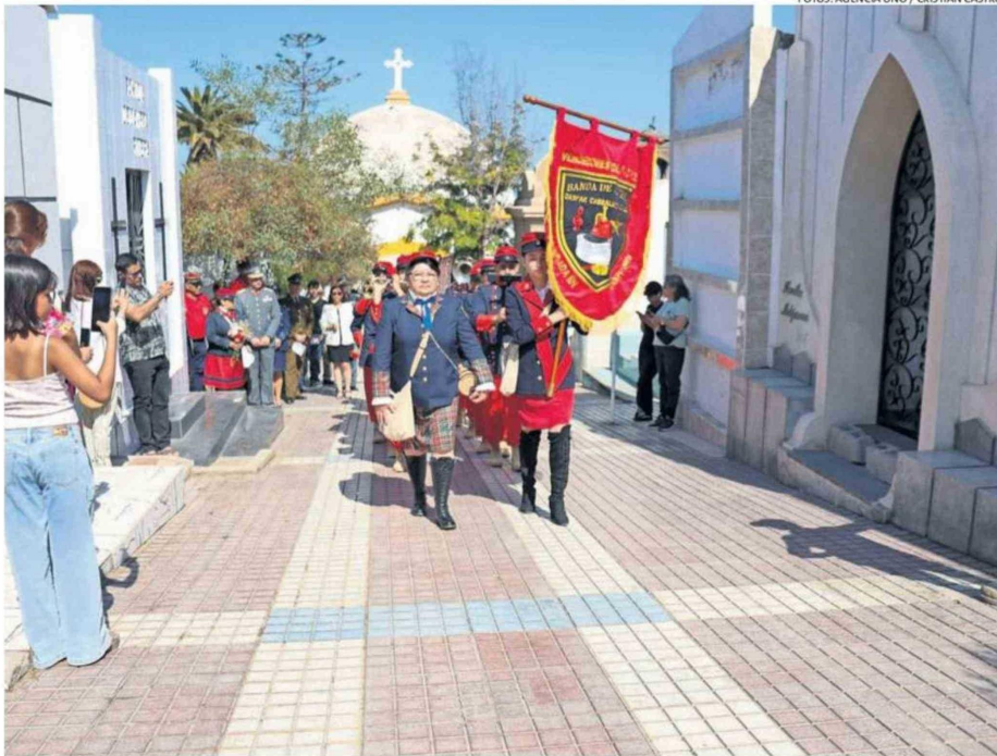
EL RECORRIDO SE INICIÓ A PARTIR DE LAS 10:00 AM DEL DÍA DE AYER DESDE LA ENTRADA DEL CEMENTERIO DE ANTOFAGASTA.

Para ello, se programó un recorrido al interior del Camposanto en donde asistieron representantes de la autoridad comunal,