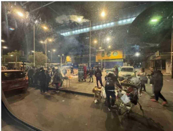
EL COMERCIO AMBULANTE SE TOMA EL SECTOR DEL GIMNASIO TECHADO DÍA Y NOCHE.

PARTE DEL PAISAJE Desde la Cámara de Comercio de Alto Hospicio y el Tamarugal, su presi-