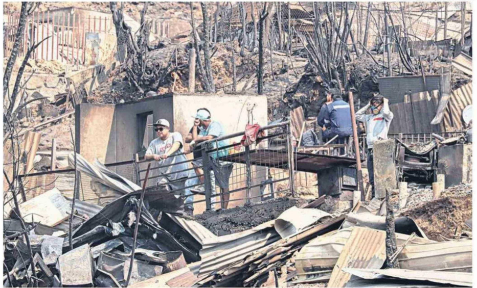
FAMILIAS VOLVIERON A SUS CASAS PARA ENCONTRARSE SOLAMENTE CON LOS ESCOMBROS QUE QUEDARON TRAS EL MEGAINCENDIO.

“Al final llegamos a un espacio de tierra donde había varios vecinos espe-