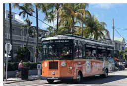
FLORECIENTE. La isla de Key West atrae a miles de viajeros en Florida.