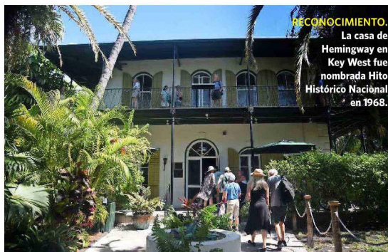
RECONOCIMIENTO. La casa de Hemingway en Key West fue nombrada Hito Histórico Nacional en 1968.