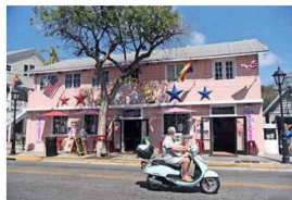
ESTILO. Duval Street es la calle principal de Key West, de alegre arquitectura. Al lado, Key West es el último cayo de Florida y el punto más meridional de Estados Unidos.