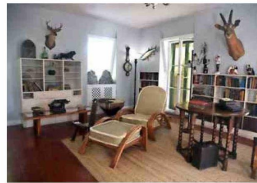
ESTUDIO. Aquí es donde en las mañanas Hemingway se encerraba a escribir.

acaba de fallecer, con casi cien años). La principal característica de estos gatos es que tienen un dedo adicional en las patas, y llevan nombres de personajes famosos, una tradición que se conserva. El primero que conocimos fue Oscar Wilde, un colibrí atigrado que retozaba en los sillones del salón principal; luego muchos otros vinieron a husmearnos.