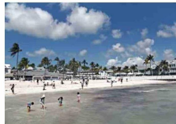
VECINO. A pasos de la casa se llega a esta playa. Cuba está cerca de allí.